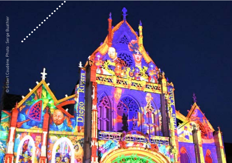
© Gilbert Coudène, Photo : Serge Buathier

An extraordinary light show during all summer is projecting on the royal monastery of Brou, the theatre and the city Hall in the city center. Like more than 100 000 people last year, the light show will let you voiceless thanks to the beautiful stories told through these walls full of history. It's also a good way to enjoy and discover Bourg-en-Bresse, its culture appointment and its heritage, particularly the exceptional royal monastery of Brou.