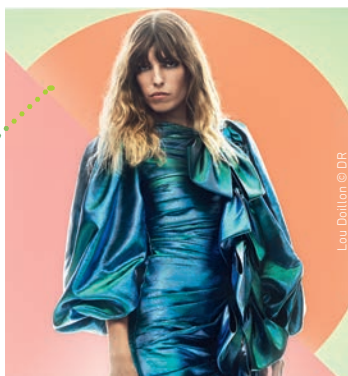
Lou Doillon

SAMEDI 17 AOÛT Un soir de swing Jazz manouche