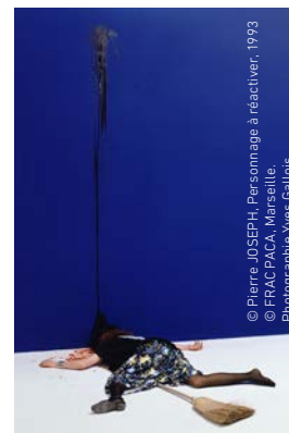
© Pierre JOSEPH, Personnage à réactiver, 1993 © FRAC PACA, Marseille.

H2M-Espace d'art contemporain 5, rue Teynière Jusqu'au 28 juillet, du mercredi au dimanche de 13 h à 18 h – Gratuit