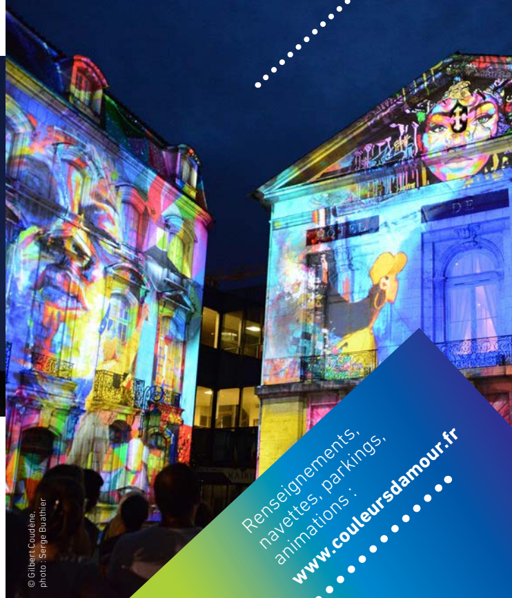
© Gilbert Coudène, photo : Serge Buathier

An extraordinary light show during all summer is projecting on the royal monastery of Brou, the theatre and the city Hall in the city center. Like more than 100 000 people last year, the light show will let you voiceless thanks to the beautiful stories told through these walls full of history. It's also a good way to enjoy and discover Bourg-en-Bresse, its culture appointment and its heritage, particularly the exceptional royal monastery of Brou.